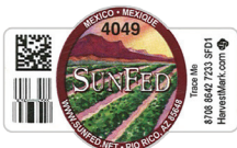
EJEMPLO DE UNA ETIQUETA CON UN CODIGO HARVESTMARK